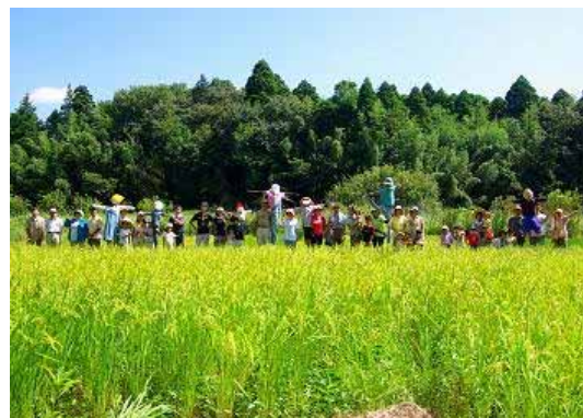
谷津田での米作り