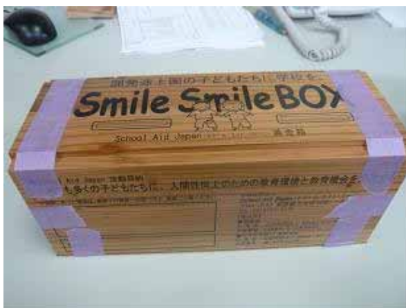
山武杉を使った募金箱