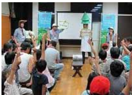
「森の博士」プログラム