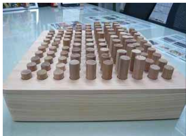
間伐材で作ったおもちゃ